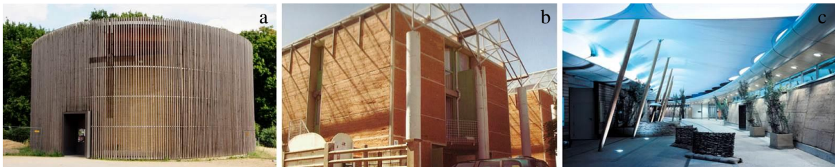
Figura 4 – Capela da Reconciliação, habitações em Isle d'Abeau e Eden Project.

Outra abordagem será o abandono dos métodos tradicionais de proteção, que passam a ser substituídos por elementos de menor expressão ou por metodologias mais sofisticadas, que procuram compensar a fragilidade criada pela exposição dos elementos em terra (Ponte, 2013). Entre estas metodologias encontram-se: a adição de produtos (Walker et al , 2005); a compactação mecânica; a utilização de cofragens que evitam a formação de juntas horizontais, etc. (Minke, 2006). Recorre-se cada vez mais a fachadas desprovidas de reboco, embasamentos baixos ou impercetíveis, assim como à ausência de proteção superior (Ponte, 2013).