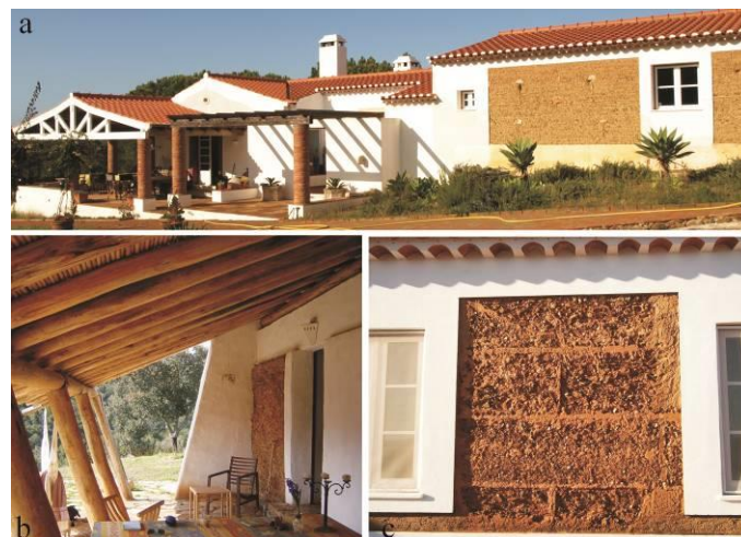
Figura 5 – a – Casa Pica Noz. Créditos: Ponte, 2013; b - Vale da Vela. Créditos: Arq. Miguel Peixinho; e c - Casa no Carvalho. Créditos: Ponte, 2013.

Por outro lado, começam a ser construídos edifícios de carácter “mais minimalista” onde, à semelhança do que se passa no estrangeiro, os telhados, os embasamentos e os rebocos são eliminados da sua conceção e substituídos por elementos de menor expressão. As coberturas começam a ser planas e o topo dos muros rematado por materiais mais resistentes do que a terra. O mesmo acontece com a proteção inferior que vai perdendo dimensão tornando-se quase impercetível. As camadas de sacrifício também são eliminadas e a taipa é totalmente exposta (Ponte, 2013). De acordo com estes princípios encontram-se alguns exemplos: