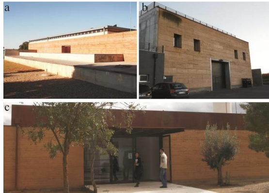
Figura 6 – a - Casa em Beja; b - Adega de vinho Herdade do Rocim; e c - E.T.A.R de Évora.