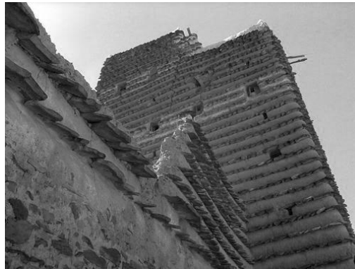
Figura 3 – Stones Village na Arábia Saudita.

Outra abordagem diferente pode ser vista na Stones Village na Arábia Saudita, onde nas paredes de terra são introduzidas fileiras de pedra salientes com uma pequena inclinação, formando linhas horizontais com intervalos regulares (ver Figura 3). Estes elementos proporcionam a diminuição da velocidade da água das chuvas que, por vezes, cai com grande intensidade na região (Dethier, 1982).