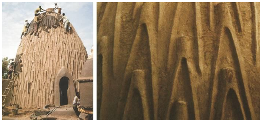
Figura 2 – A decoração funcional das Musgum Houses.

Nos Camarões, as casas Obus de Musgum, apresentam uma forma ogival e uma expressão esculpida ao nível do reboco, que parece ser estritamente decorativa (ver Figura 2). Todavia, tanto a forma como o trabalho exterior, são fruto de opções de desenho intencionalmente funcionais. A forma ogival permite uma maior estabilidade e conforto térmico interior e, à semelhança de Djennè, permite a diminuição do impacto da chuva nas paredes. Os relevos exteriores, para além de servirem como andaimes para a manutenção após a época das chuvas, permitem desviar as gotas de água e diminuir a sua velocidade (Fontaine & Anger, 2009). No fundo, o reboco exterior interage diretamente com a sua própria agressão (Ponte, 2013).