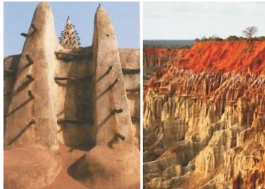
Figura 1 – Relação entre a forma das torres da Mesquita de Djennè (esquerda) e a erosão natural do solo (direita). Créditos: Fontaine & Anger, 2009 e Agata Terrao, 2012.

várias camadas de terra, e que permite também aos habitantes acederem às estacas de madeira, ao mesmo tempo, estes elementos servem de andaimes que permitem a manutenção anual após a época das chuvas (Fontaine & Anger, 2009).